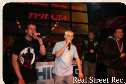
Real Street Rec.

фестивале представляли две группы: Real Street Rec и N.A.Com. Последние уже второй год подряд выходят в финал Пробы, что говорит о стабильности коллектива. А трек RSR «Едем на